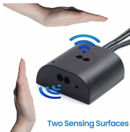
Two Sensing Surfaces

Sensor de proximidad doble para tiras LED monocolor de 5 a 24V DC. Controla encendido/apagado e intensidad al pasar la mano a una distancia menor o igual a 8 cm. Incorpora dos sensores de alta sensibilidad para control desde dos ángulos diferentes, de acuerdo a las necesidades de instalación. Cuenta con 3 modos de fijación posibles.